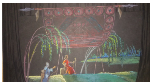
Şək. 3; 4.