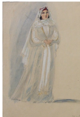
Şək. 1; 2.