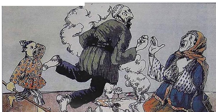
Əziz Əzimzadə. "Uşaqdır". 1914