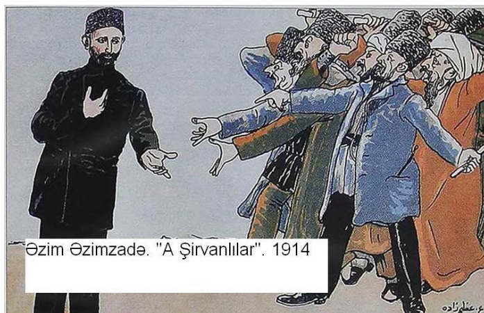
Əziz Əzimzadə. "A Şirvanlılar". 1914