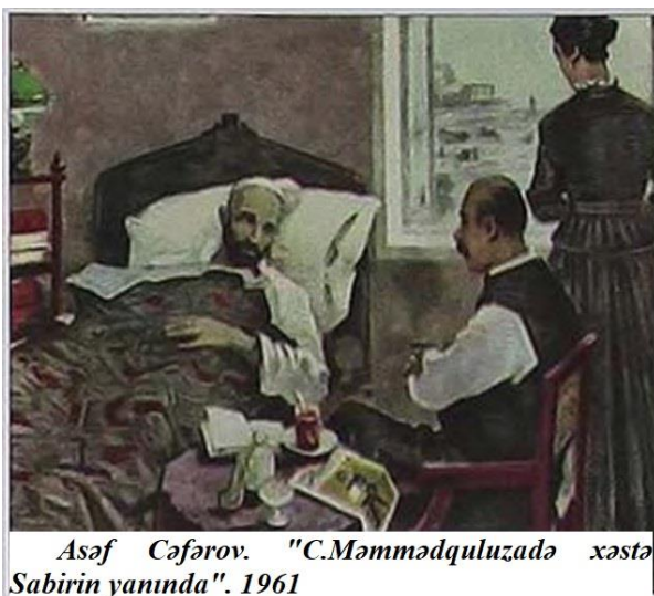
Asəf Cəfərov. "C.Məmmədquluzadə xəstə Sabirin yanında". 1961