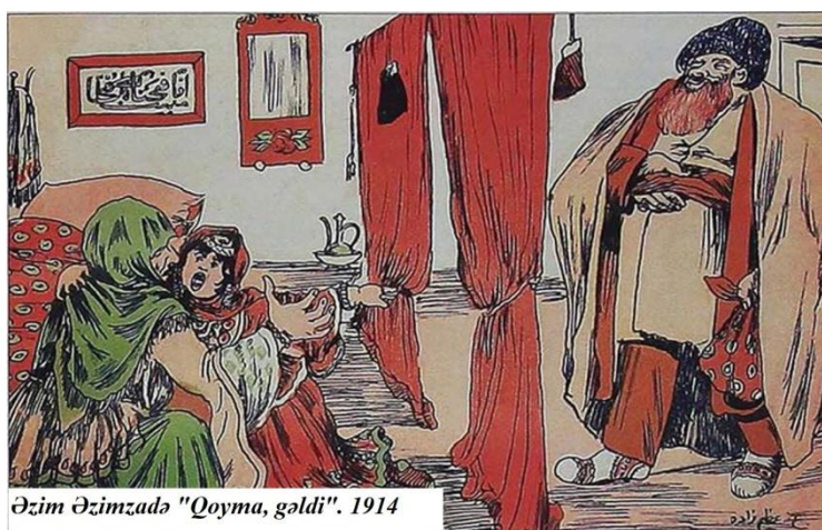
Əziz Əzimzadə "Qoyma, gəldi". 1914