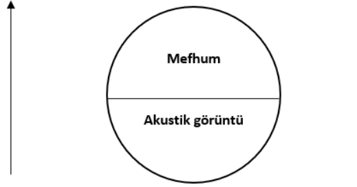
Tablo 1. Dil işaretinin ikili zihinsel modeli.

can dilinin açıklamalı sözlüğünde yenen şeyi tutmak, dişlemek için ağızda olan kemikli töreme olarak geçer. Çocuğun dişi, dişleri kamaşmak, diş ile tutmak vb. olduğu gibi tarağın dişi, saat çarkının dişi ifadeleri de kullanılmaktadır. Örneklerden de görüldüğü üzere kelimenin temel anlamlarından yola çıkarak kavramın çağrıldığı ve açıklamasında ifade edilen özellikleri sıralanmıştır. Burada temel anlam daha genel, içeriğin genişliği bakımından farklılık gösterir. Ayrıca, yazar hipotezini F. de Sossör'ün şeması ile daha anlaşılır kılar.