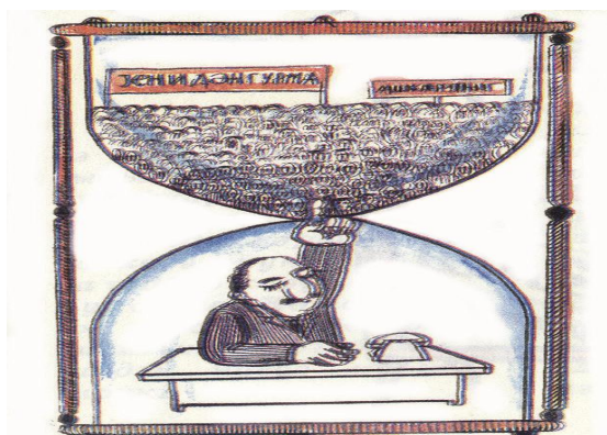
Şək.2. “Vəzifə”. B.Qasimov (“Kirpi”, 1990).