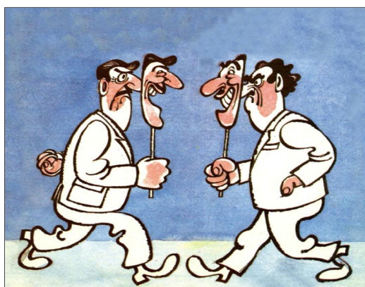
Şək.1. “-Səni görməyimə çox şadam! -Mən də şadam, əzizim!”. V.Allahyarova (“Kirpi”, 1984).