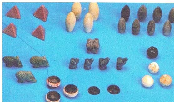
Рис.2. Фигурки, обнаруженные в кургане Батур Хаюк (3100-2900 гг.до н.э.)