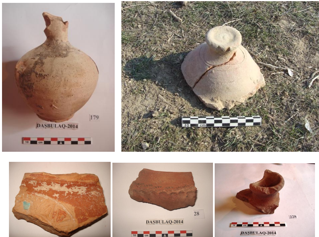
Şəkil 2-6. Müxtəlif təyinatlı saxsı məmulatı