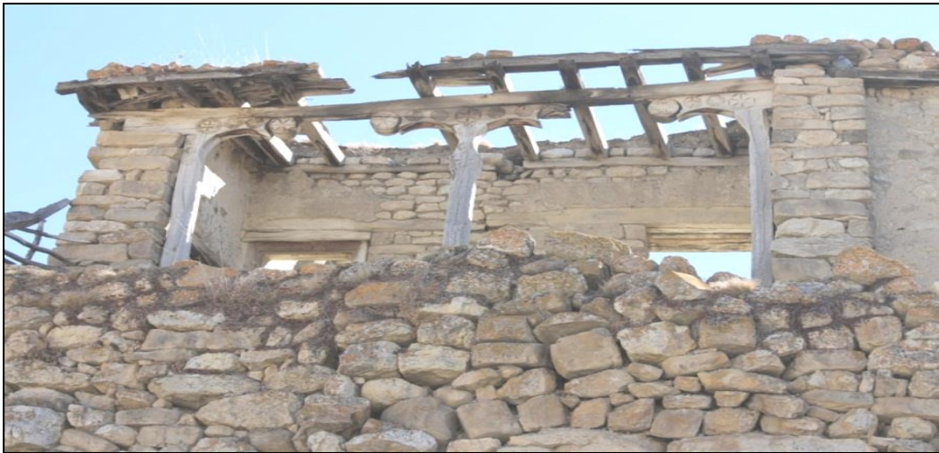
Qırız kəndində Əbu Müslüm məscidinin qalıqları

Digər Şahdağ yaşayış məntəqələrində olduğu kimi Cek kəndində də xeyli sayda, təqribən 25-dən çox qədim ziyarətərgah və dini ibadət yerləri qalmaqdadır. Kəndin ən qədim ibadətərgahlardan olan Əbu Müslüm məscidi- nin tikintisi islam dininin Azərbaycanda ilk yayıma mərhələsinə - VII-VIII əsrlərə aid edilir.