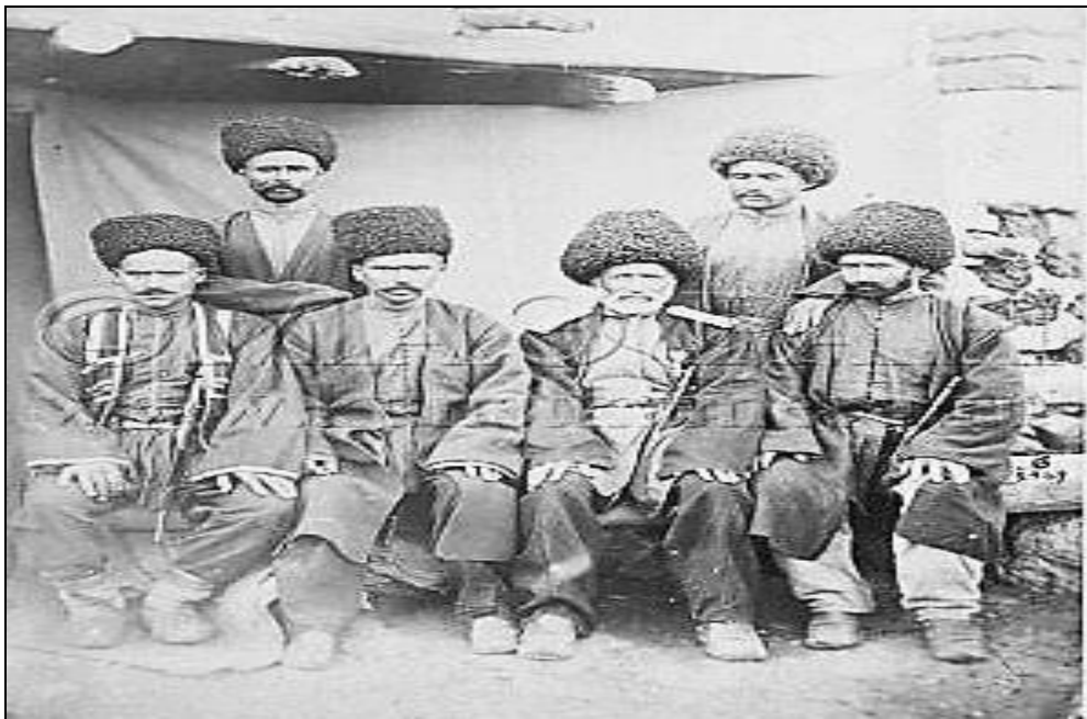
Qızlar D.Yermakov, 1880

Təqdim edilən məqalədə qədim alban tayfalarının varislərindən olan qızların, həmçinin qız etnosuna aid edilən hapıt, cek, əlik və yergüclərin etnik tarixi, yayılma arealı, etnogenetik əlaqələri, etnik ənənələri və bir sıra mərasim ayinləri araşdırılmışdır.