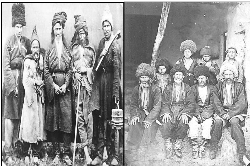
Ceklər (XIX əsrdə çəkilmiş fotosəkillər. D.Yermakov, 1880)

rə, XIX əsrdə baş vermiş həmin miqrasiya prosesləri nəticəsində Qırz, Cek, Əlik kəndlərində cəmi 1037 nəfər əhali qalmış, əvəzində isə Xaçmaz, İsmayılı, Qəbələ və Ağdaş bölgələrində 23 yeni kəndi salınmışdı (4). Yeni ərazilərdə məskunlaşmış cek və əliklər haqqında ətraflı məlumat vermiş XIX əsr müəllifi, statistik və etnoqraf Nikolay Zeydlis «1859-1864-cü illərdə Rusiya imperiyasının yaşayış məntəqələrinin Bakı quberniyası üzrə siyahısı» ilə bağlı hesabatında vaxtilə Cek kəndinin 294 tüstüdən ( evdən ) ibarət olduğunu, sonralar buradan Baqıoba, Ağarəhimoba, Dəyirmanoba, Çuxuroba, Ağarzaoba, Əliməmmədoba, Xamuştəpələr, Sultanoba, Sultanmahmudoba, İbrahimoba, Ağalaroba, Həşimoba, Şıxioba, Çobanoba, Rəhimoba, Qıraqlıoba, Müzəffəroba, Aşuroba, Almazqazmalar, Daşdəmiroba, Heydəroba, Ağarzaoba, Əbdüləziz oba, Əlimirzə oba, Əzizbəyoba, Ramazanoba, Mollaoba, Davudoba, Məlikoba, Şirinoba, Xırdaoymaq, Səfixanoba kimi kiçik məhəllə-nəsillərin ayrıldığı qeyd etmişdir (5, s.94-95). Elə həmin mənbənin verdiyi məlumata əsasən, XIX əsrdə Əlik kəndindən Daldəlik, Çanaxar, Məmərzabəyoba, Meyralıqışlağı, Hümmətiqışlağı, Yusufqışlağı, Əhmədxanqışlağı, Mollamahmudqışlağı, Mürsəliqışlağı nəsillər yeni məskənlərə köç etmişlər.