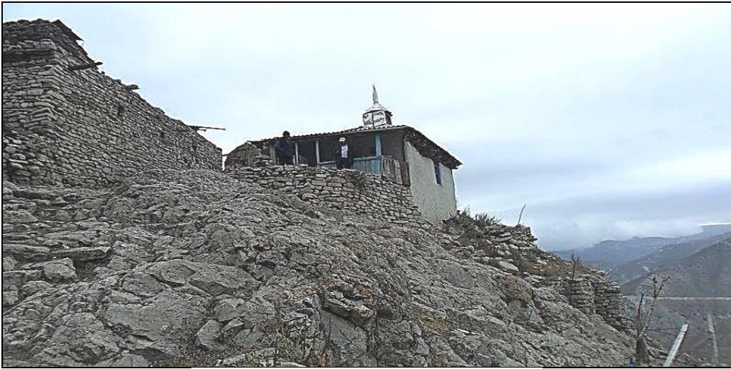
Cek kəndindəki Əbu Müslüm məscidi

Lakin bu ibadətqah həm arxitekturasına, həm də tərtibat elementlərinə görə ənənəvi məscidlərdən fərqlidir və islama qədər olan qədim inancların, xüsusilə də Günəş kultu ilə bağlı bir sıra elementləri qoruyub saxlamışdır. Sıldırım qayaların üzərində inşa edilmiş tikilinin üzərindəki ornamentlərdə Qafqaz Albaniyası xalqlarının hələ xristianlıqdan öncə tapındıqları Günəş kultuna aid sakral işarələrə rast gəlinir. Bu elementlər həmin tikilinin bənzəri olan və eyni adı daşıyan Xınalıq və Qrız məscidlərində də vardır. Etnoqrafik araşdırmalar bu ibadətqahların vaxtilə qədim Günəş məbədlərinin üzərində inşa edildiyini söyləməyə əsas verir (24, s.142-143).