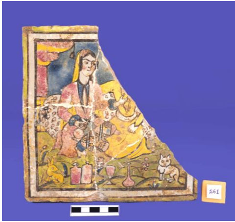
Şəkil 1 Kaşı üzərində insan və təbiət təsviri – Xaraba şəhər(Ağsu r-nu)