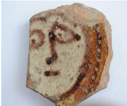
Şəkil 3 Antopomorf təsvirli şirli qab –Qala (Qəbələ)