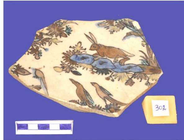
Şəkil 2 Zoomorf təsvirli şirli qab –Xaraba şəhər (Ağsu r-nu)