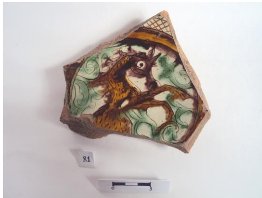
Şəkil 4 Vəhşi heyvan təsvirli qab nümunəsi –Qəbələ Qala