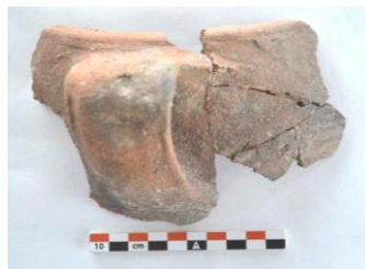
Şəkil 9. Gil qazan fraqmenti