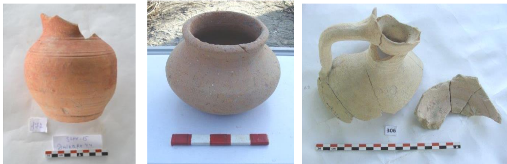
Şəkil 6-8. Bardaq, küpə və kuzə tipli gil qablar