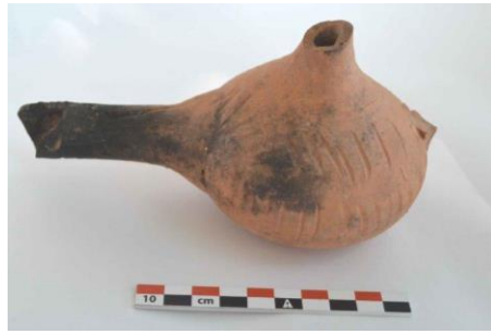
Şəkil 1. Gil çıraq