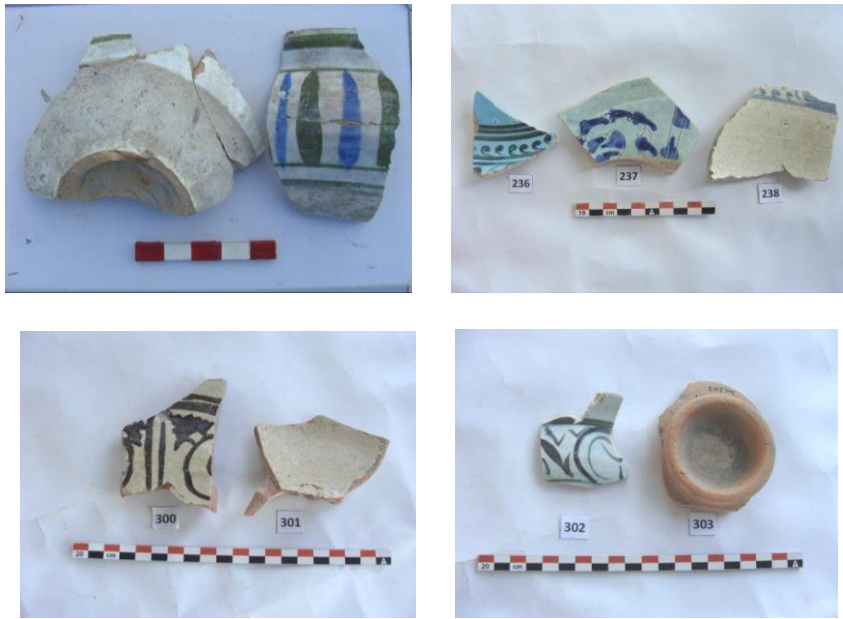
Şəkil 2-5. Küpə və bardaq tipli gil qablara məxsus fraqmentlər