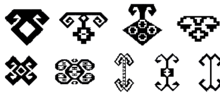
4. Xalça və xalça məmullatları üzərindəki qoç ideoqram-naxışları