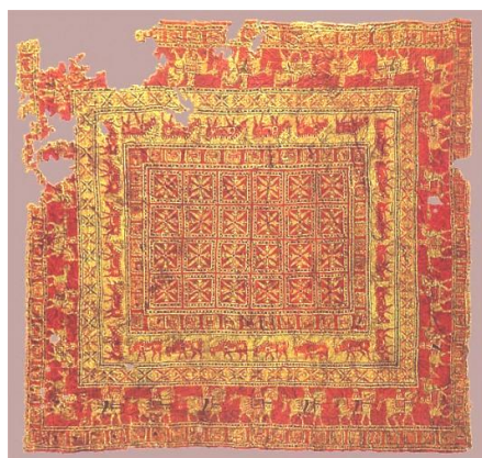
5. Pazırq xalısı