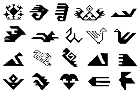
2. Xalça və xalça məmullatları üzərindəki quş ideoqram- naxışları