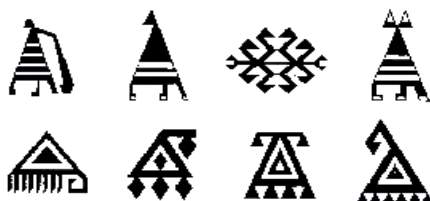
3. Xalça və xalça məmullatları üzərindəki əqrəb ideoqram-naxışları