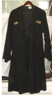
Şəkil 3. Çuxa (MATM inv.№3944)