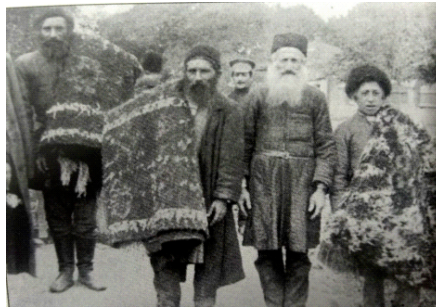
Şəkil 7. Yerli xalçaları satan dağ yəhudiləri (MATM NF inv № 2941)