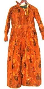
Şəkil 4. Bulşey (don) (MATM EF inv.№4385)