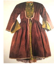
Şəkil 6. Altda "bulşey" adlanan don. (Mountain Jews Customs and Daily Life in the Caucasus. The İsrail Museum. Jerusalem kitabına istinad edilmişdir)