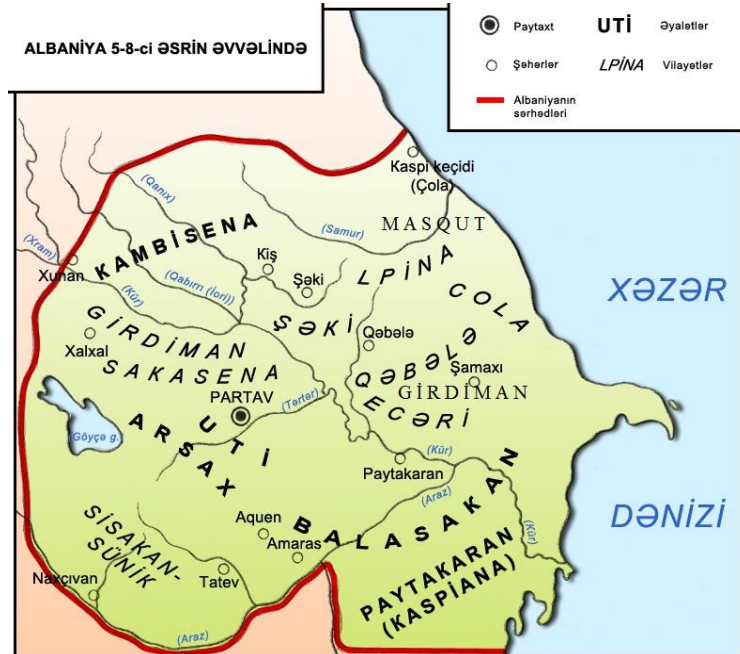
Xəritə 1. Qafqaz Albaniyasının ilk orta əsr inzibati xəritəsində Kaspiana (Paytakaran və ya Balasakan) əyaləti