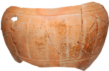
I Tablo. Təsərrüfat küpləri