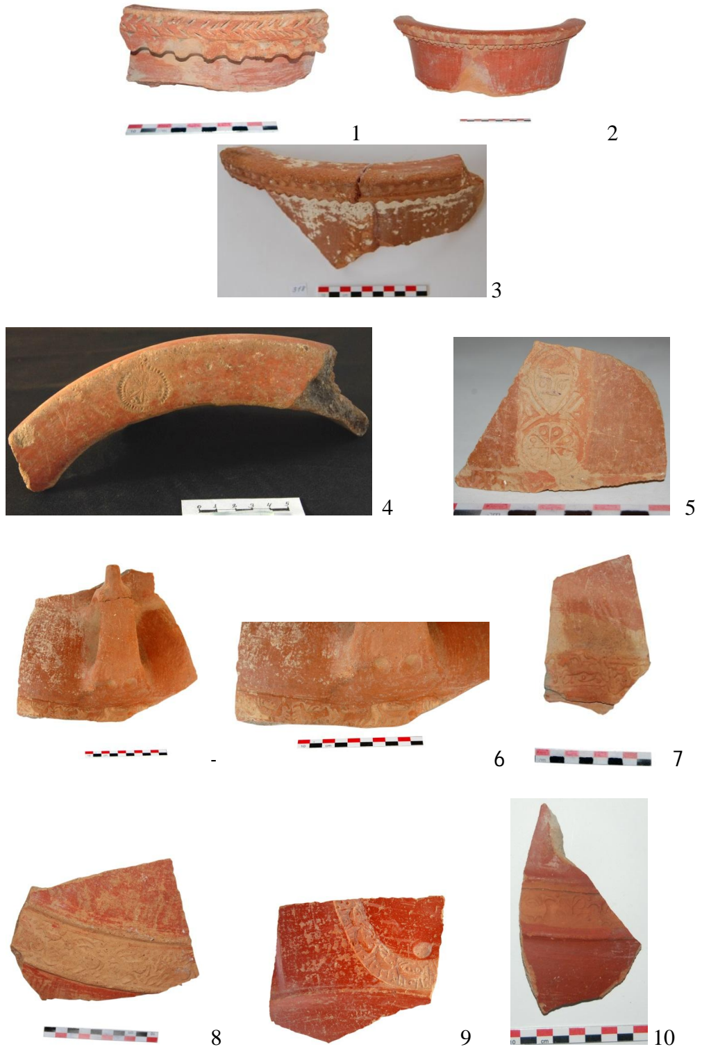
III Tablo. Boyalı küp fraqmentləri