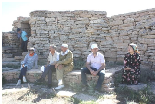
9. Внешность подземного мечети Султан-Епе

сооружения мечети в скале напоминает храмовый комплекс Кешишдаг, расположенный на территории Акстафинского района Азербайджанской Республики и являющийся скальным храмом Кавказской Албании.