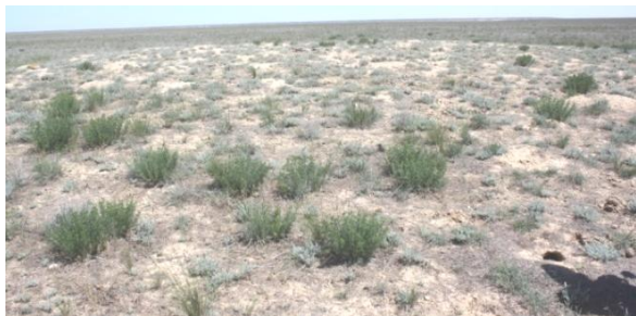
2. Курган № 1.

Курган №3 – 44.28.598 N; 050.53. 272 E, на высоте 169 м. над уровнем моря.