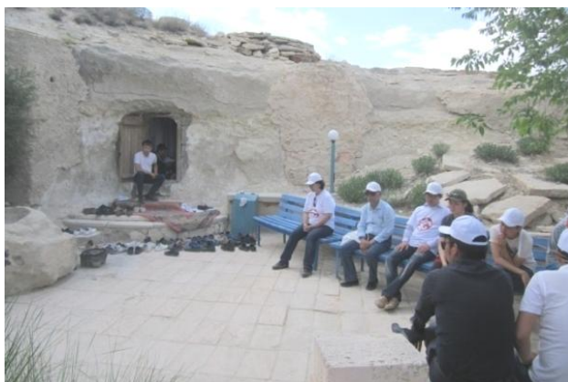
19. Подземный мечеть Шопен-Ата

Далее мы побывали в памятнике XIII-XIX вв. – Шопен-Ата. Этот памятник по сегодняшний день используется в качестве кладбища. А в подземной мечети продолжают проводить религиозные обряды. У большинства могил до сих пор продолжает бытовать обряд зажигания огня. Во время осмотра погребения типа кургана, принадлежащего предку –