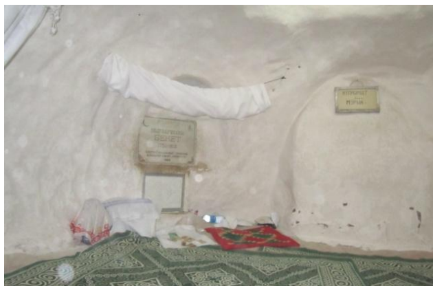
22. Подземная мечеть Бекет Ата

Далее мы ознакомились с колодцами в Мангистауской пустыне. Глубина колодцев более 30 м. Вблизи этих колодцев были зарегистрированы еще два кургана. Один из них находится по координату 44.09.540 N; 053.57.505 E, на высоте 217 м. над уровнем моря, а другой по координату 44.09.540 N; 053.57.547 E, на высоте 216 м. над уровнем моря. На одном