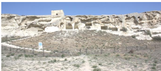
10. Внешность Шакпак-Ата