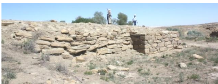
13. Часть раскопанной участки Кызыл Гала

Одним из интересных для нас памятников, осмотренных во время поездки, явился памятник Кызыл Кала, в небольшой части которого некогда были проведены археологические исследования. Он находится по координату 44.14.776 N; 051.59.254 E, на высоте 131 м. над уровнем моря. Во время полевого осмотра было найдено большое количество образцов керамики. Памятник находится вблизи маленького оазиса в пустыне. Здесь во время археологических раскопок были открыты одна из четырехугольных цитаделей Нарынкалы, часть крепости, вероятно, являющаяся запасным входом и маленький участок в стороне от Нарынкалы. Недалеко от Нарынкалы находятся руины другого круглого сооружения. Возможно оно являлось либо надзирательным пунктом, либо предусматривалось для проведения религиозных церемоний. Ни в пределах Нарынкалы, ни за его пределами глазурованная керамика практически не встречается. А с другой стороны, некоторые образцы керамики, собранные с местности, по нашему мнению относятся к периоду железа. Предполагаем, что заселение оазиса произошло гораздо раньше. Для этого здесь существуют все необходимые ресурсы.