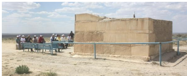
18. Памятник Гызыл Сай