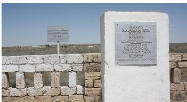
27. Некрополь Караман-Ата

Памятник Караман-Ата X-XIX вв. весьма интересный. Он состоит из некрополя и подземной мечети. Здесь встречается множество разнотипных погребений, а подземная мечеть отличается от других подземных мечетей количеством и просторностью комнат.