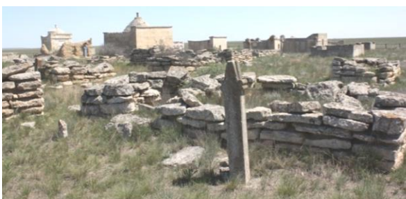
5. Некрополь Каракашты-Аулие

Следующим, осмотренным нами памятником, явился некрополь Уш-Там X-XV вв. Происхождение топонима «Уш-Там», видимо, связано