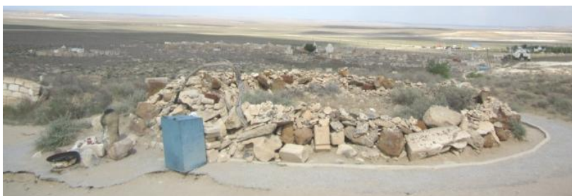
20. Гробница отца Шопан-Аты и фаллос

«Ата» памятника Шопен-Ата, наше внимание привлек один фаллос. Этот фаллос и по сей день является культовым местом и объектом поклонения среди бесплодных женщин, над которым зажигается огонь.