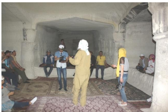
11. Внутри Шакпак-Ата

В рамках поездки мы побывали еще в одном памятнике – заповеднике и музее – Отпан-Тау. Можно сказать, что памятник был устроен на самой высокой точке Мангистауской области относительно уровня моря, на вершине горы. Это место почитается и посещается местными жителями, как святыня. В последующие периоды здесь появились современные постройки и был воздвигнут памятник волка. Территория, на которой находится памятник волка, занимает половину территории святыни, сооруженной в форме круга из скальных глыб. Святыня устроена над курганным могильником. Это каменное сооружение (курган) расположено по GPS координату 44.11.497 N; 051.53.300 E, на высоте 533 м. над уровнем