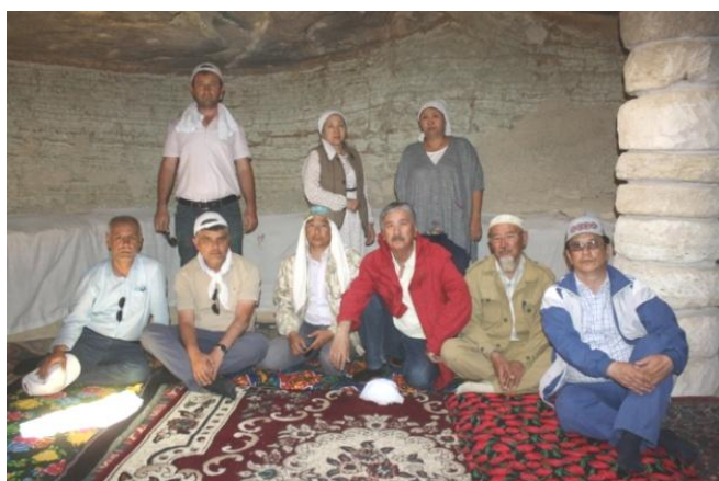
28. Подземная мечеть

На основе анализа археологических материалов из вышеуказанных памятников и местных краеведческих музеев, осмотренных по назначенному маршруту и первичных выводов из визуальных наблюдений, можно сказать следующее: