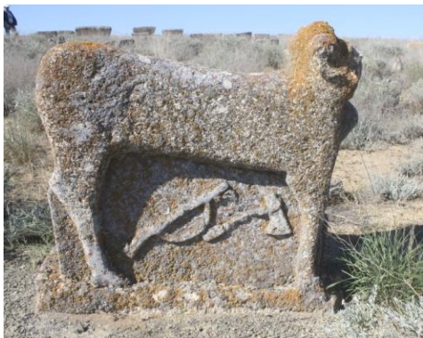
17. Надгробный памятник в форме Гошдаш

Весьма интересен памятник Масат-Ата. Здесь встречаются погребальные памятники, отличающиеся друг от друга специфическими особенностями. Наряду с многочисленными надгробными памятниками типа каменных изваяний барана, привлекают особое внимание ниши в верхней части надгробий для зажигания в них огня. Кроме того, отметим, что здесь в подземной мечети религиозные ритуалы проводятся и поныне.