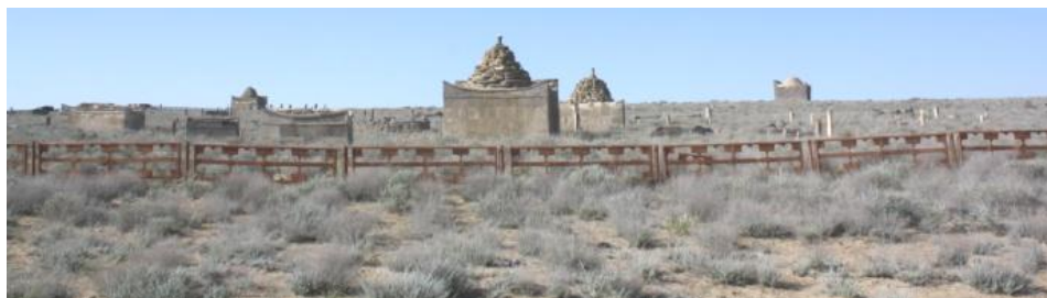
16. Памятник Масат-Ага