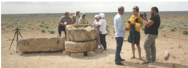
23. Колодцы Мангустау

из этих курганов хотя и устроена железная конструкция типа вышки, но она видимо не тронула могильную камеру.