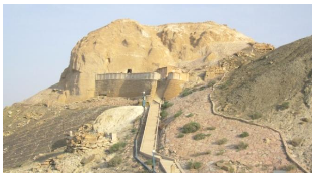
21. Святилище Бекет-Ата

Уникален памятник Бекет-Ата. Так, что здесь наряду с погребальным памятником привлекает внимание мечеть-медресе и подземная мечеть в коньоне, построенная за последний период. Количество посетителей святынь Шопен-Ата и Бекет – Ата намного больше.