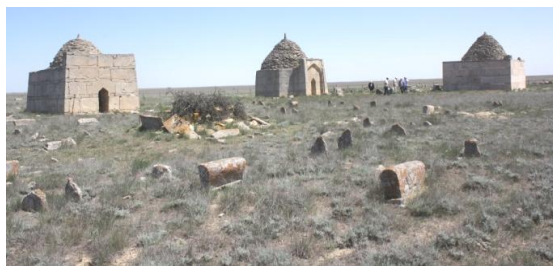
6. Некрополь Уш-Там

с имеющимися здесь тремя гробницами. Здесь имелись отличающиеся друг от друга камни-надгробия, на которых были вырезаны рельефы, отражающие профессии усопших.