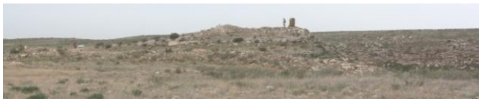
26. Наблюдательная башня порта

Памятник Караман-Ата X-XIX вв. весьма интересный. Он состоит из некрополя и подземной мечети. Здесь встречается множество разнотипных погребений, а подземная мечеть отличается от других подземных мечетей количеством и просторностью комнат.