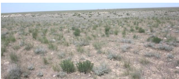
4. Курган № 3