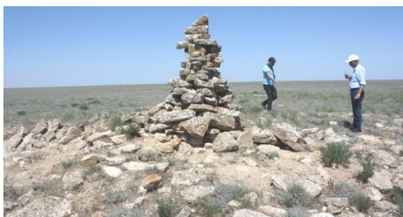
3. Курган № 2