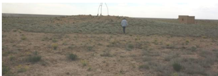
24. Курганы обнаруженные рядом с колодцами

Кладбище Сисем-Ата относится к XIII-XX вв. и богато разнотипными погребениями указанных периодов. На одной стороне кладбища имеется памятник типа кургана, вероятно, более раннего периода. В центре кладбища имеется холм с памятной плитой в честь Сисем-Ата, который на наш счет также является курганом.