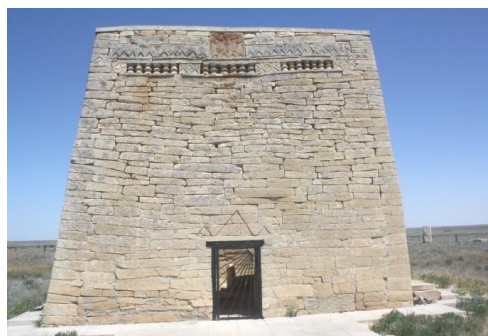
7. Памятник в форме пирамиды Кенти-Баба

Очередным объектом визита стал памятник X-XVI вв.- Кенти-Баба. Большой интерес здесь вызвал памятник в виде пирамиды. Кроме этого здесь были зафиксированы различные гробницы и надмогильные памятники указанного периода.