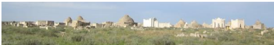
25. Кладбище Сисем-Ата

Кладбище Сисем-Ата относится к XIII-XX вв. и богато разнотипными погребениями указанных периодов. На одной стороне кладбища имеется памятник типа кургана, вероятно, более раннего периода. В центре кладбища имеется холм с памятной плитой в честь Сисем-Ата, который на наш счет также является курганом.