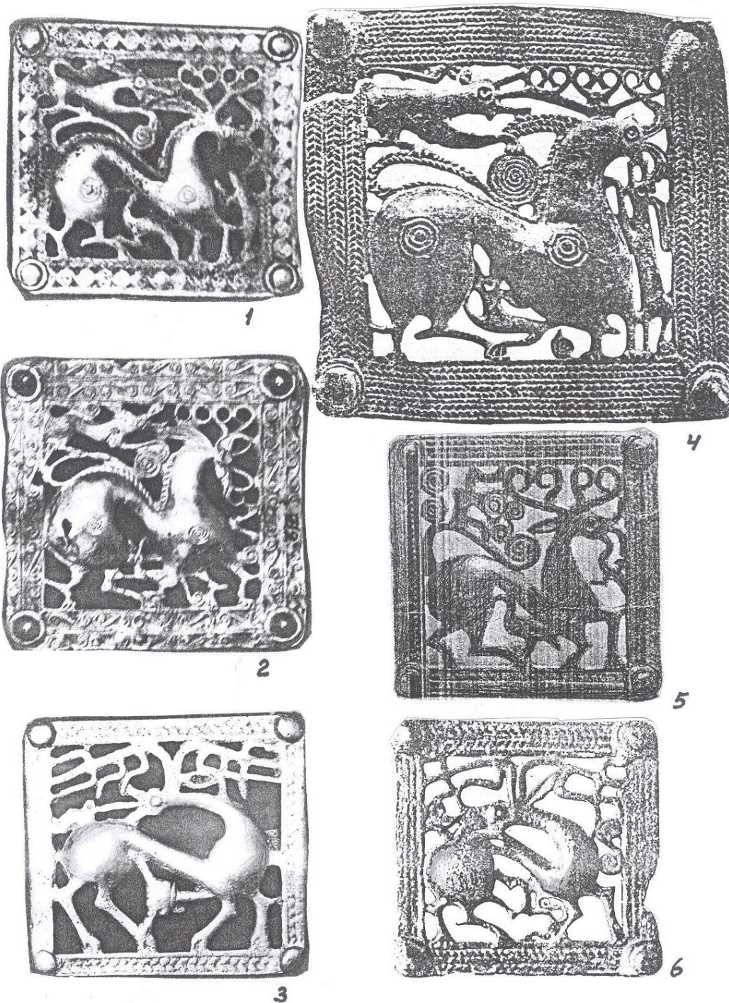
Таблица I. 1, 2, 3 – бронзовые пряжки из фонда Музея Истории Азербайджана №614, 612, 613, 4, 6 бронзовые пряжки из коллекции П.С.Уваровой, 5 – бронзовая пряжка (Б.В.Телов)